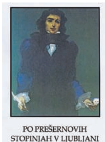
Naslovnica publikacije, ki so jo izdali člani društva