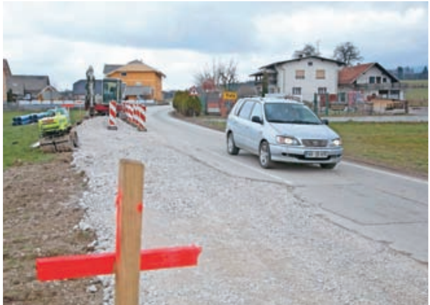
Gradnja krvavškega vodovoda je v polnem teku.