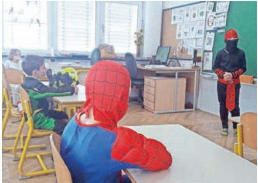
Pustovanje v zaloški šoli

Pustovanju se v času epidemije nismo odpovali. Učenci so se našemili v